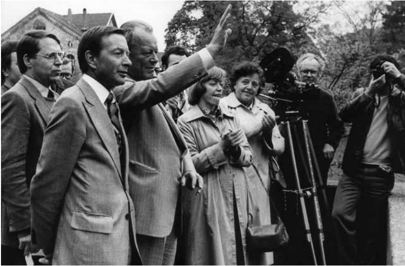
Willy Brandt in Göttingen. Wahlkundgebung im Landtagswahlkampf 1978 von der Terrasse der Stadthalle.

Der SPD-Ortsverein Göttingen feiert sein 110jähriges Bestehen: Festredner ist der Vorsitzende der SPD-Fraktion im Deutschen Bundestag, Dr. Hans-Jochen Vogel , ein gebürtiger Göttinger.